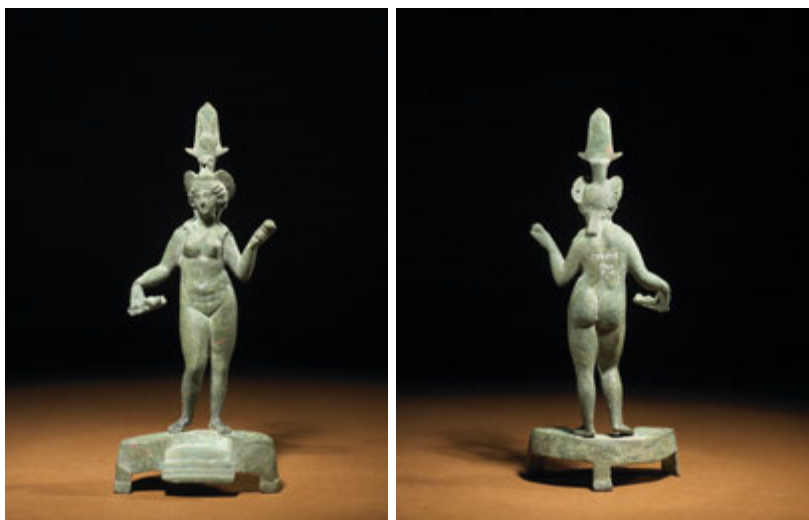
Figura de Ba'alat Gebal, a Astarté, Afrodite fenícia